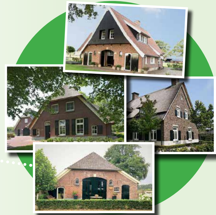
Referentiebeelden architectuur "hoofdwoning"