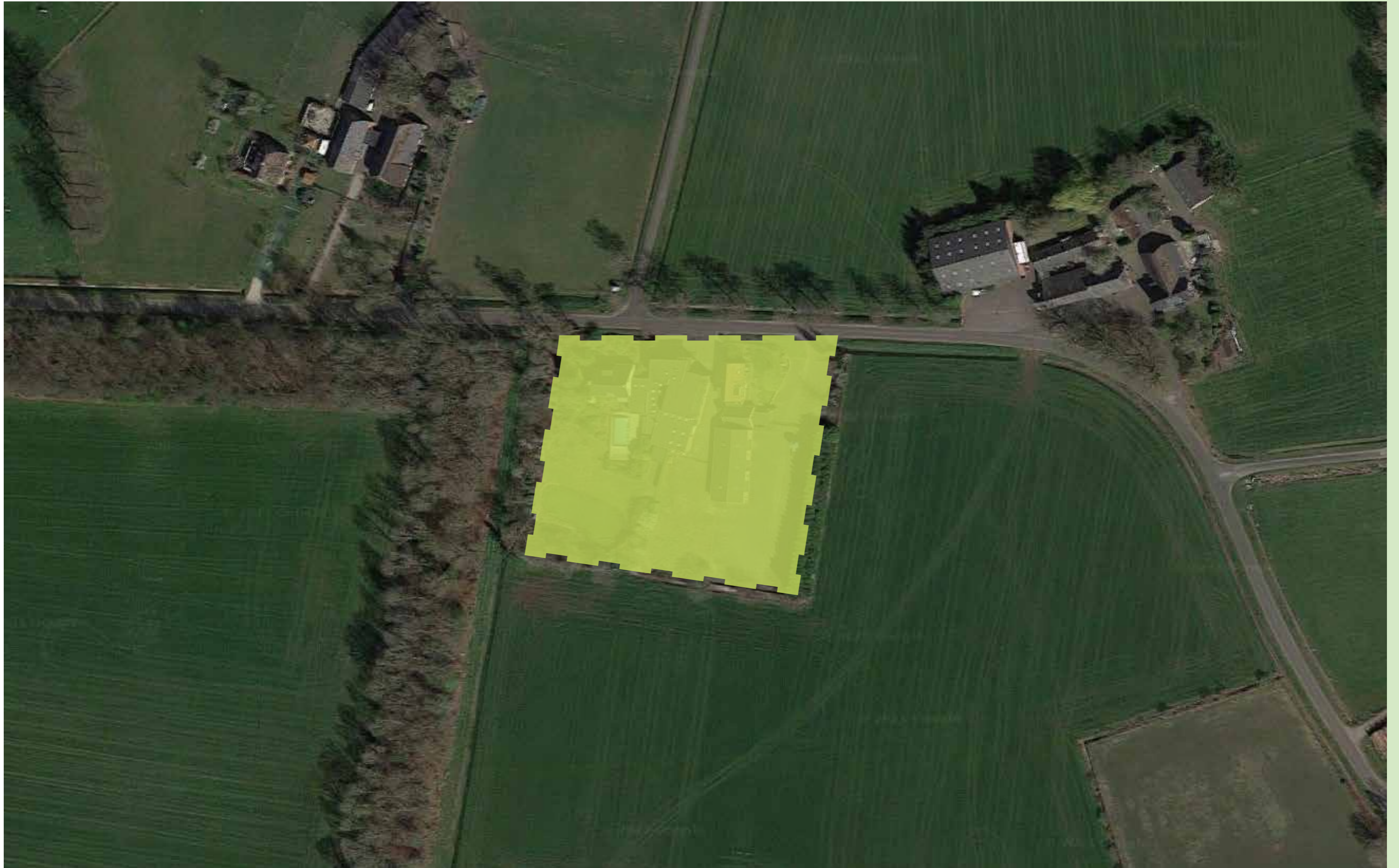
Nieuwbouw 3 woningen "Waterhook", Holten