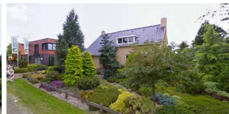
Foto's bestaande situatie