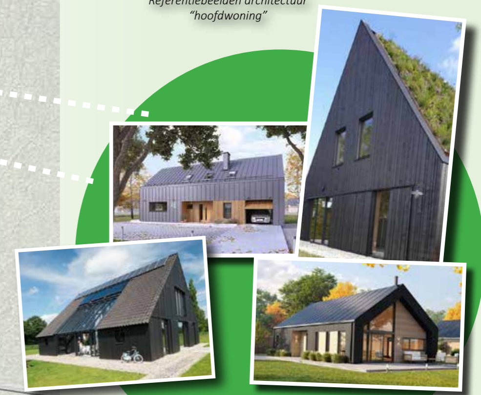
Referentiebeelden architectuur "schuurwoning"